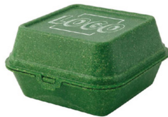
Burger-boxen (1 vlak) max. afmetingen bovenkant 80 × 80 mm