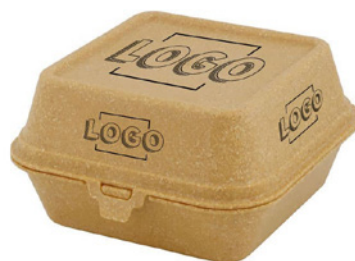
Burger-boxen (4 vlakken) max. afmetingen bovenkant 80 × 80 mm max. afmetingen zijde 80 × 20 mm