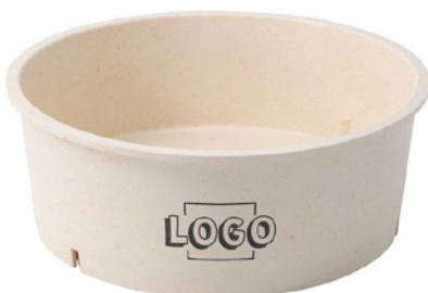
Wegwerp-bakken 1000 ml max. motiefgrootte 40 × 350 mm