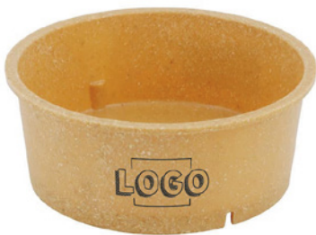
Wegwerp-bakken 650 ml max. motiefgrootte 35 × 350 mm