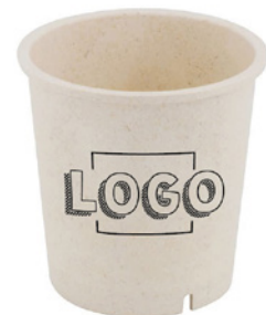
Wegwerp-bekers 400 ml max. motiefgrootte 70 × 230 mm