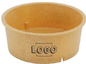
Wegwerp-bakken 650 ml max. motiefgrootte 35 × 350 mm