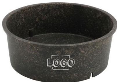
Wegwerp-bakken 1000 ml max. motiefgrootte 40 × 350 mm